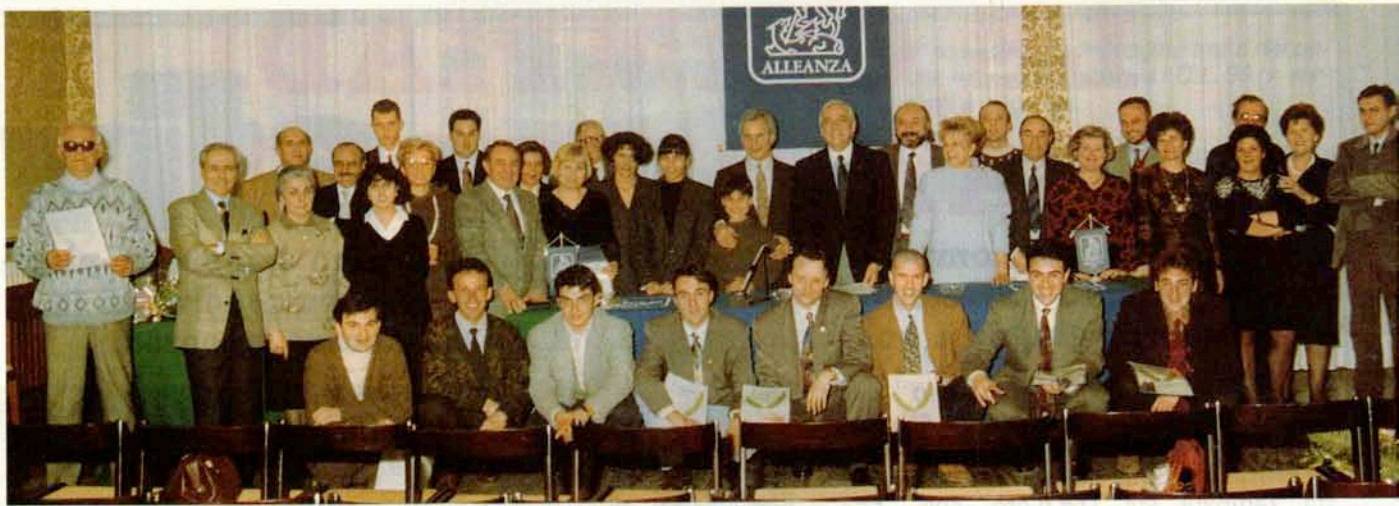
▲ Agenzia Generale di Faenza: 1° posto Gara Adeguamenti - Foto di gruppo dei Collaboratori faentini al termine della cerimonia di premiazione, alla quale hanno preso parte l'Ispettore Generale geom. Cianchi e l'Agente Generale Sig. Malvaso (ora ad Urbino).