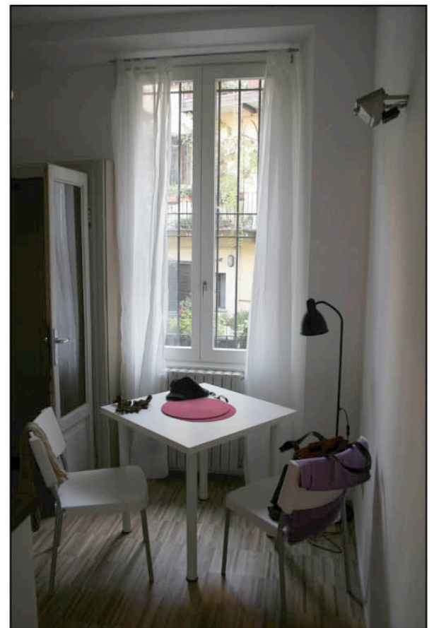
The dining area