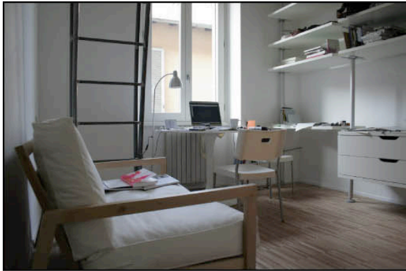
The living room