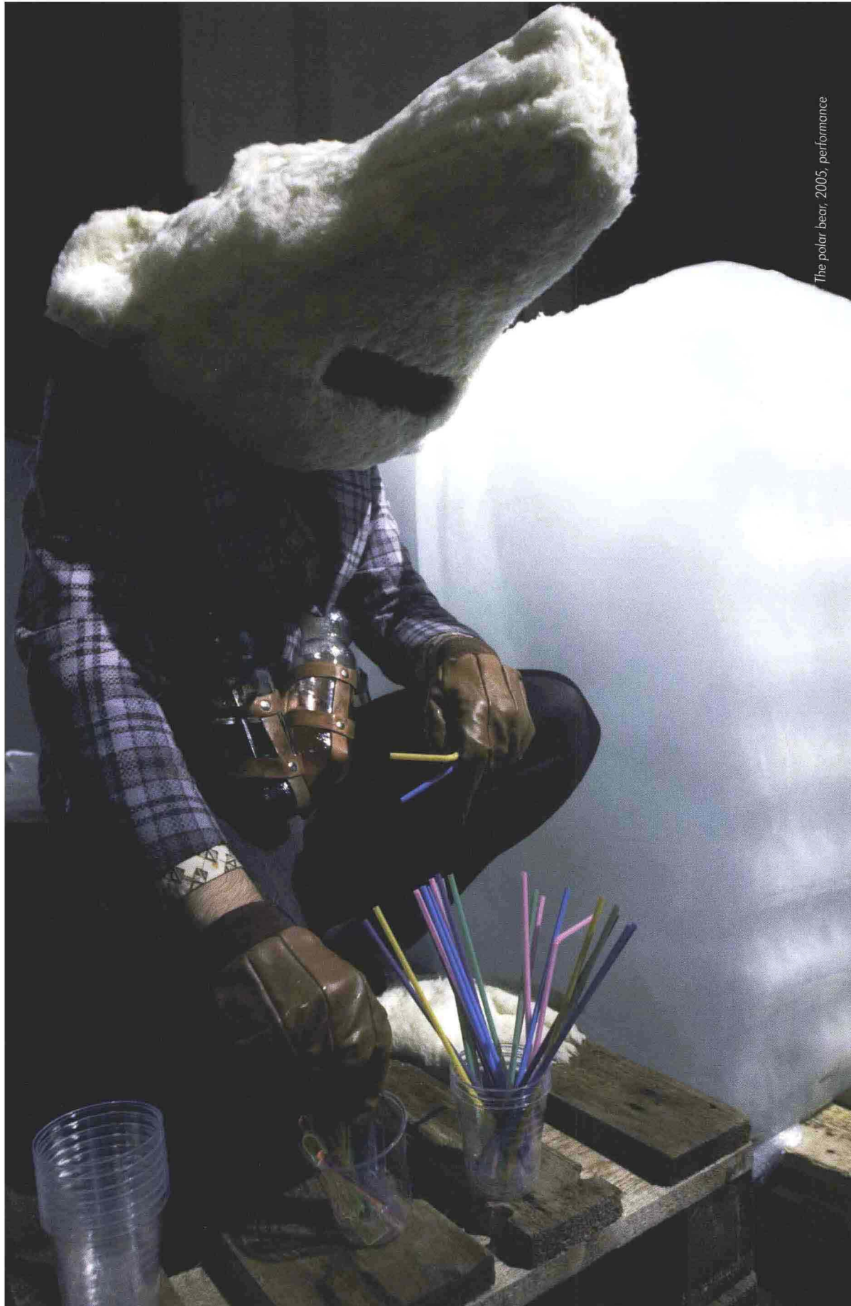
The polar bear, 2005, performance