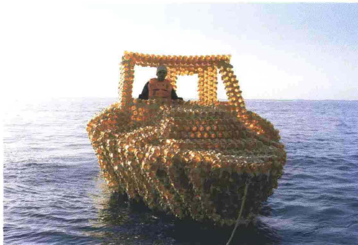
Early one morning with time to waste, 2007, foto su plexiglass, cm129x83, courtesy Fornello, Prato.