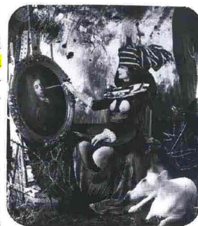
In alto, al centro. "Ascolto", 2006, di Liliana Moro; al Docva, dal 4/4 al 17/5, a cura di Milovan Farronato. Sopra. J.P. Witkin "The countess de Maublanc", 2006; al Pac, fino al 27/4, mostra a cura di Gianfranco Composti, cat. Motta; www.comune.milano.it/pac ; Sotto. Nathalie Djurberg "Hungry hippoes" (film still), 2007; alla Fondazione Prada, dal 19/4 - 19/6, mostra a cura di Germano Celant, cat. Progetto Prada arte; www.fondazioneprada.org .