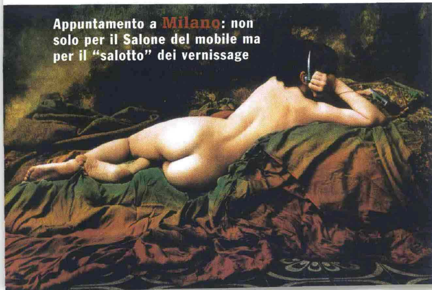
Appuntamento a Milano: non solo per il Salone del mobile ma per il "salotto" dei vernissage