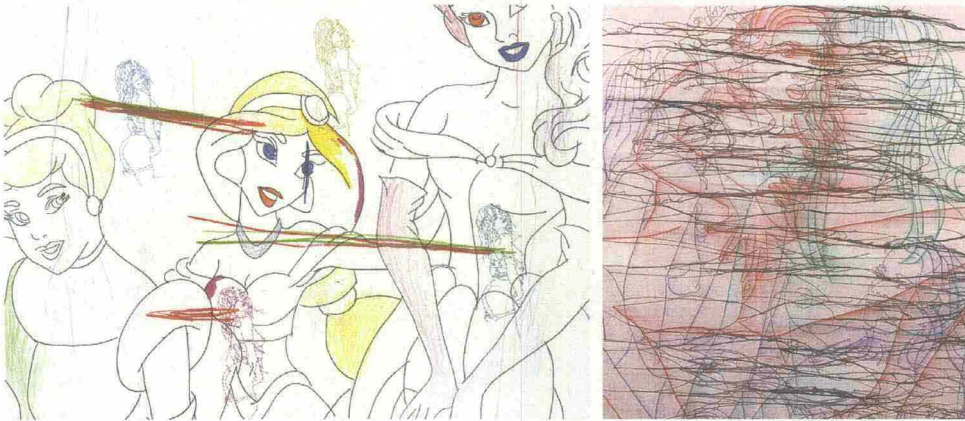
>> Ghada Amer, Untitled , 2005, part.