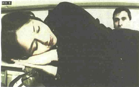
>> 1 The Otolith Group, Otolith, 2003.