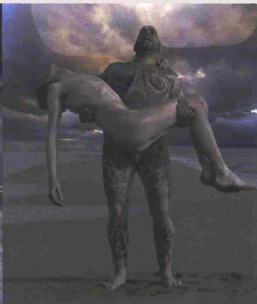
Love me, 2007 Stampa lambda su carta argentata, 125 x 187 cm