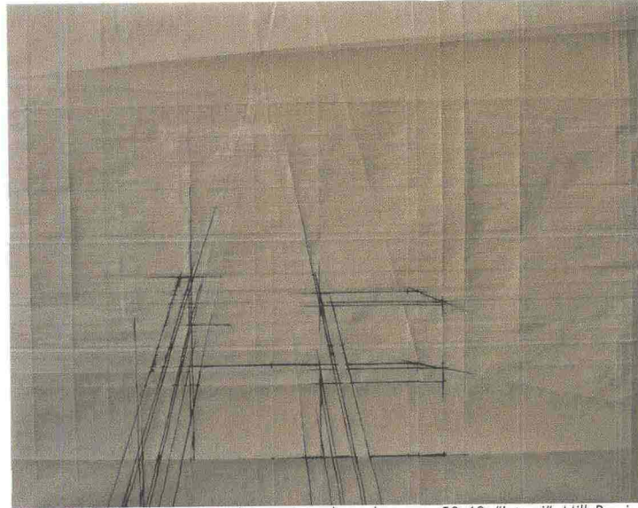
Lingeri, IC, 2007, piegature, acrilico su carta da spolvero, cm 50x63, "Interni", MillyPozzi arte contemporanea, Como.

Dalle pieghe inferte alla carta escono linee come tracce che indicano una direzione. Sono migliaia di strade che tendono all'infinito nello spazio che circonda la carta da spolvero, materia prima e punto di partenza da cui Barbara De Ponti costruisce l'opera d'arte. Tracce immaginarie, reticoli che ingabbiano e, al contempo, liberano il particolare architettonico di un edificio, un ponte o una scala, in ogni caso uno spazio urbano vissuto come luogo dell'esperienza. Così la grandezza di un palazzo viene riportata alla luce grazie al suo dettaglio, dapprima immortalato in uno scatto fotografico dal taglio sempre differente e soggettivo, per poi prendere nuova vita sulla carta, evidenziato dalla tintura nera. Il disegno si crea, piega dopo piega, partendo dal soggetto che si vuole rappresentare. Barbara De Ponti piega e riapre il foglio fino a quando tutto il progetto si trasforma in una rete tridimensionale, un linguaggio di cui ha affinato la tecnica sin dagli ultimi anni di frequentazione dell'Accademia di Belle Arti di Brera, a Milano.