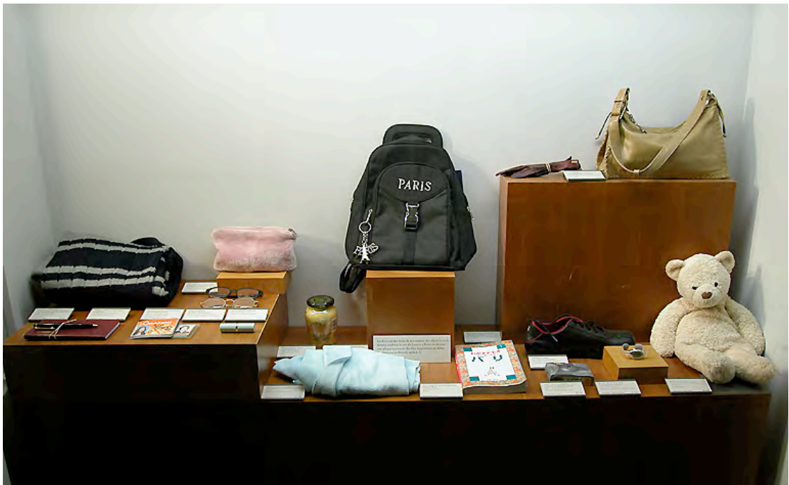
Objects trouvés au Louvre , 2000-2004, oggetti trovati