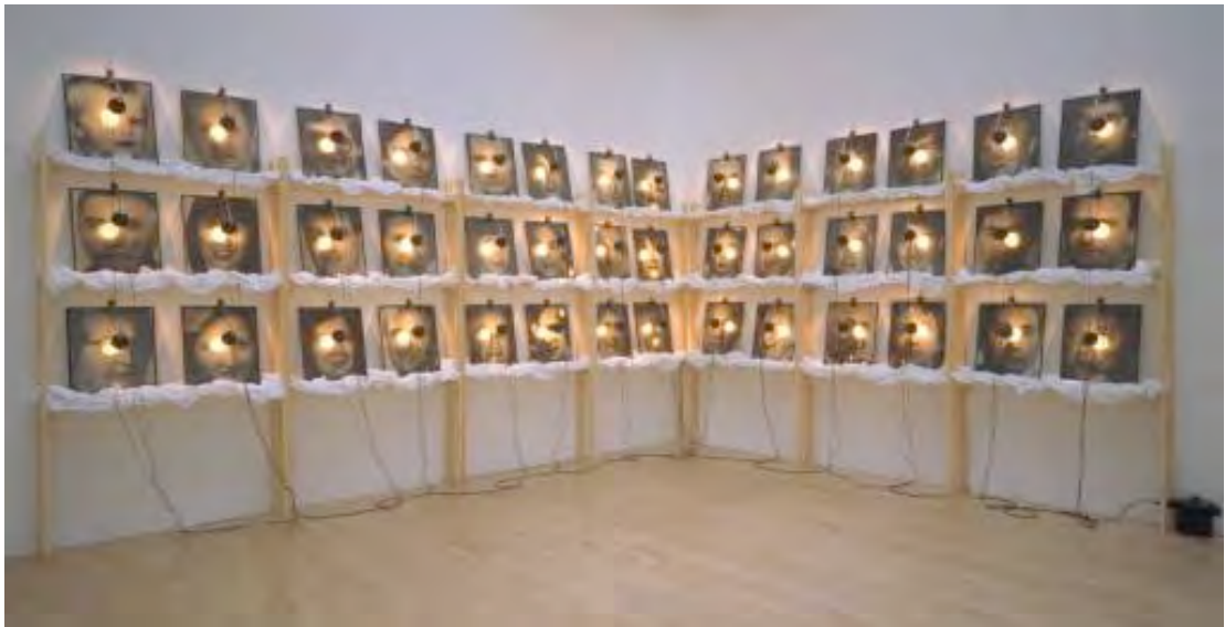
La Réserve des Suisses morts , 1990, installazione, fotografie, cavi elettrici, lampadine, legno 283 x 472 x 27 cm