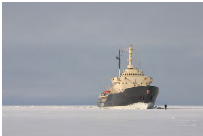
Nummer acht. Everything is going to be alright, 2007, Video 16mm to in alta definizione, 10'

Nell'opera di Van Der Werve l'uomo fugge dalla noia, che l'artista stesso concepisce come motivo fondativo dell'eterno peregrinare dei suoi personaggi nel teatro del mondo.