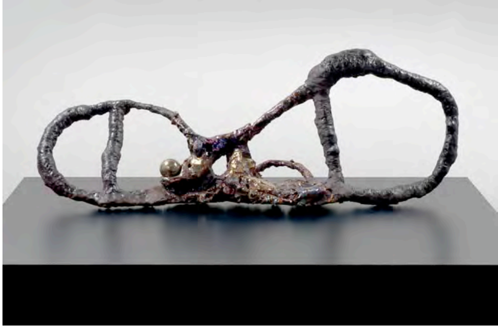
Figure Maker with Sphere , 2007, scultura in ceramica, piedistallo in formica, 45 x 24 x 170 cm