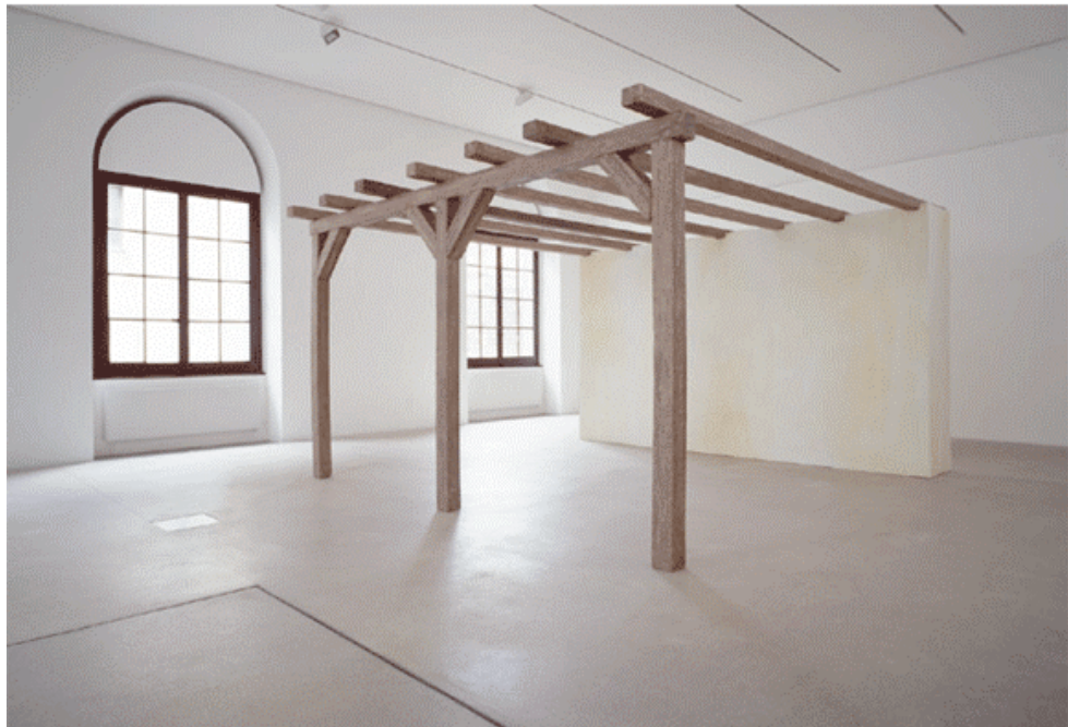
Pergola , 2001, polystirene, vetroresina, resina sintetica, pittura acrilica 350 x 350 x 225 cm