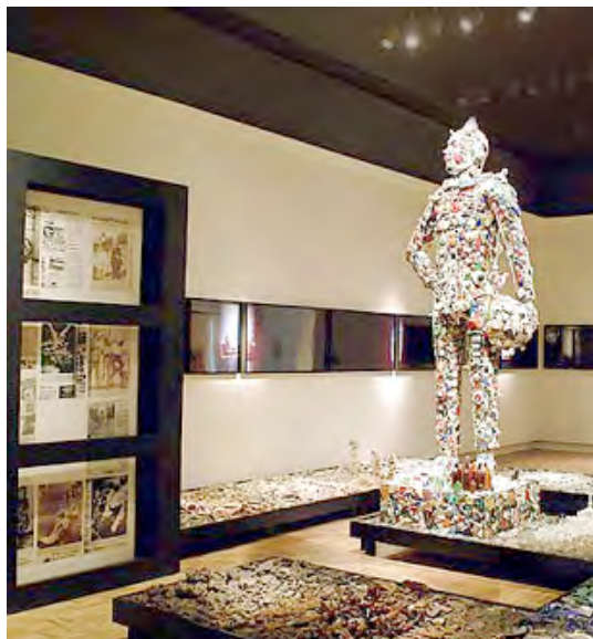
Blackout, installazione materiali vari, 2001

L'artista mescola così il proprio percorso artistico alle tracce lasciate dalla storia sulla sua città natale, imprimendo alla materia il pathos del ricordo.