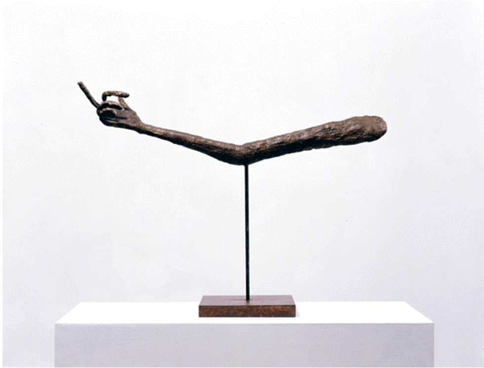
La main , 2006, scultura, legno, metallo, resina acrilica, pittura, 70 x 45 x 10 cm