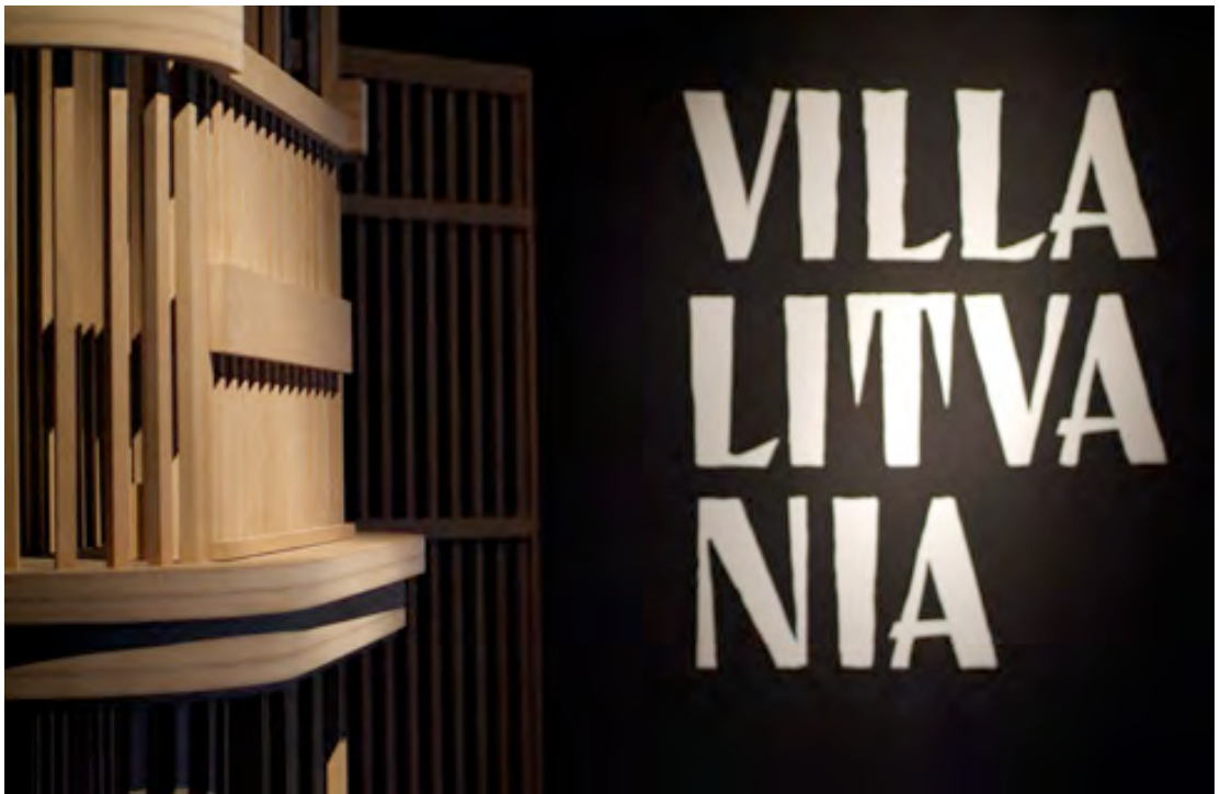
Villa Lituania , 2007, installazione, materiali vari, dimensioni variabili