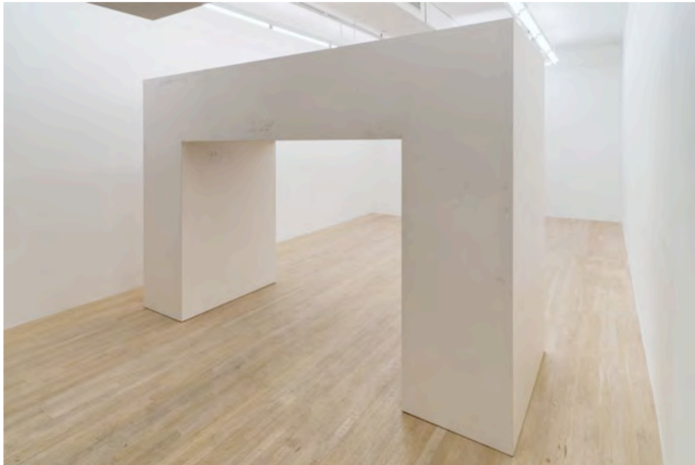
Superoverpass , 2007, installazione, formica, legno, viti, colla, 223 x 3356 x 122 cm