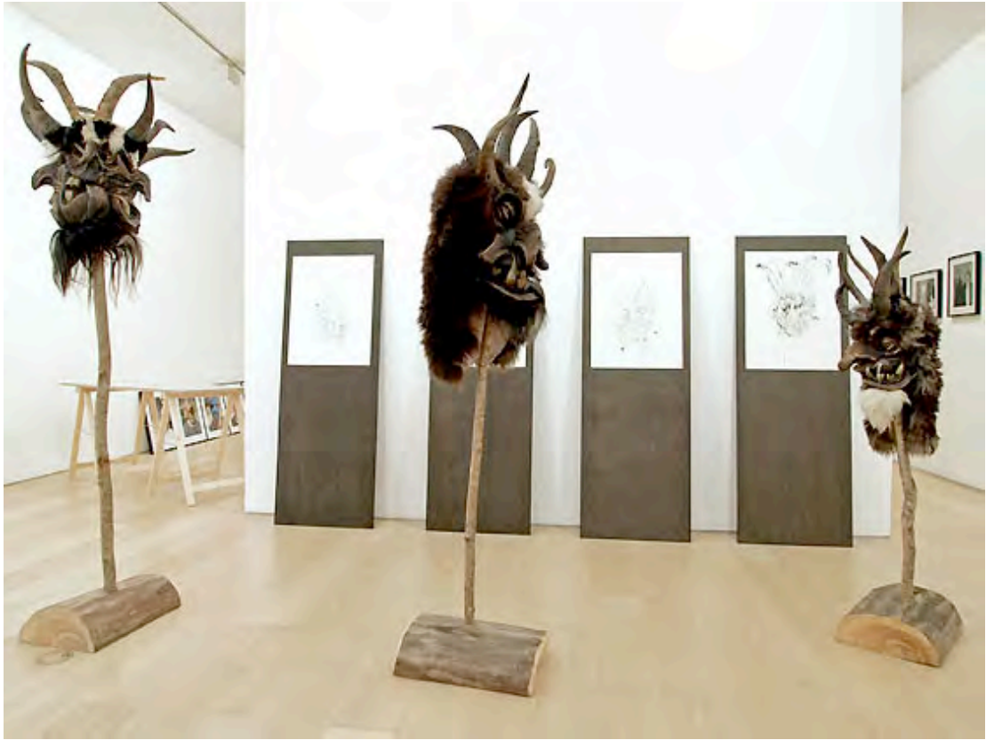
Kranky Klaus , 2003, studi per tre film: Kranky Klaus , materiali vari