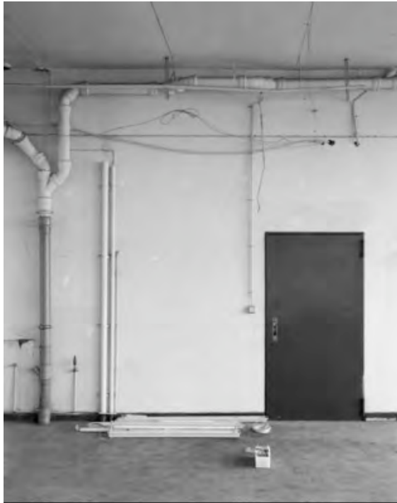
Untitled , 2007 carta baryth 130 x 100 cm