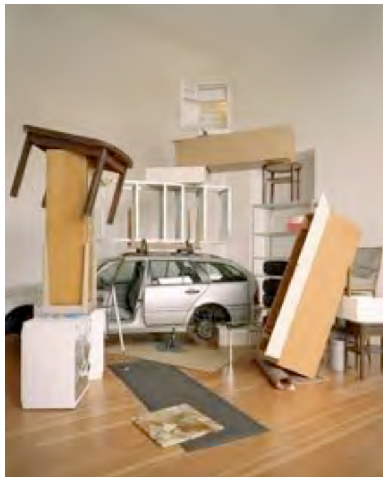
Verkündigung , 2003, oggetti trovati, dimensioni variabili