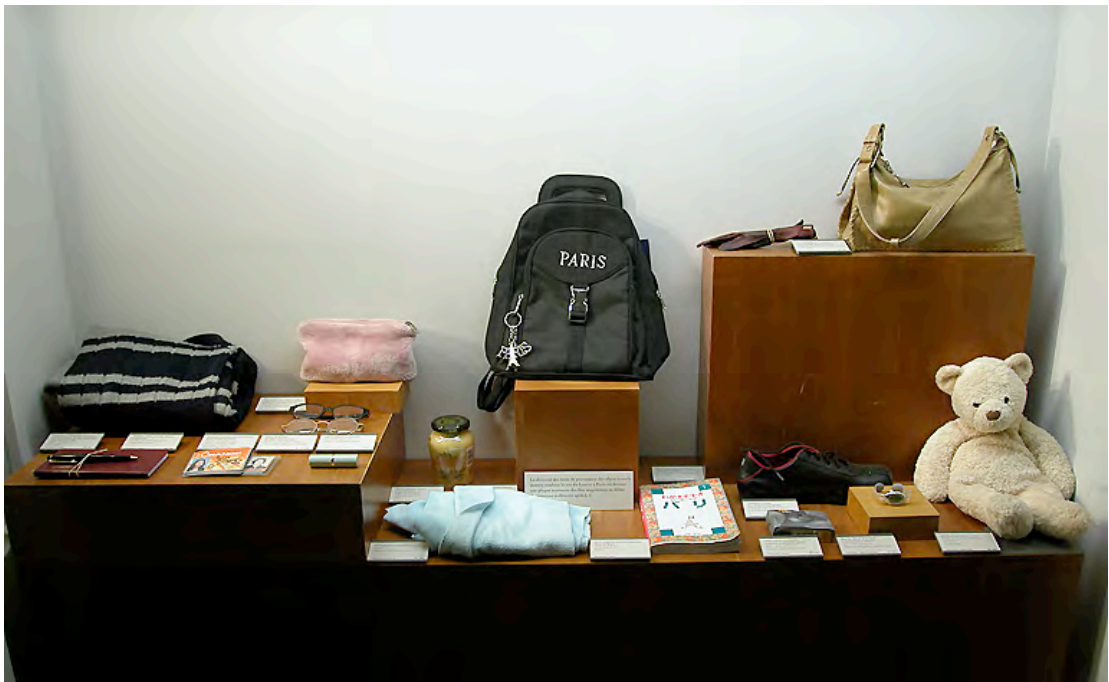
Objets trouvés au Louvre , 2000-2004, oggetti trovati