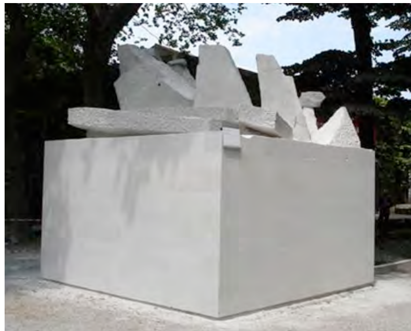
Minimal Romantik , 2005, performance, marmo