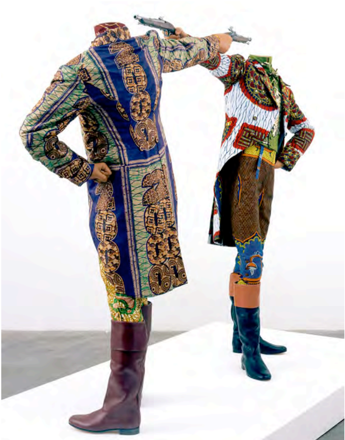
MBE, How to blow up two heads at once, 2006, manichini in scala umana, stoffa, pistole, accessori