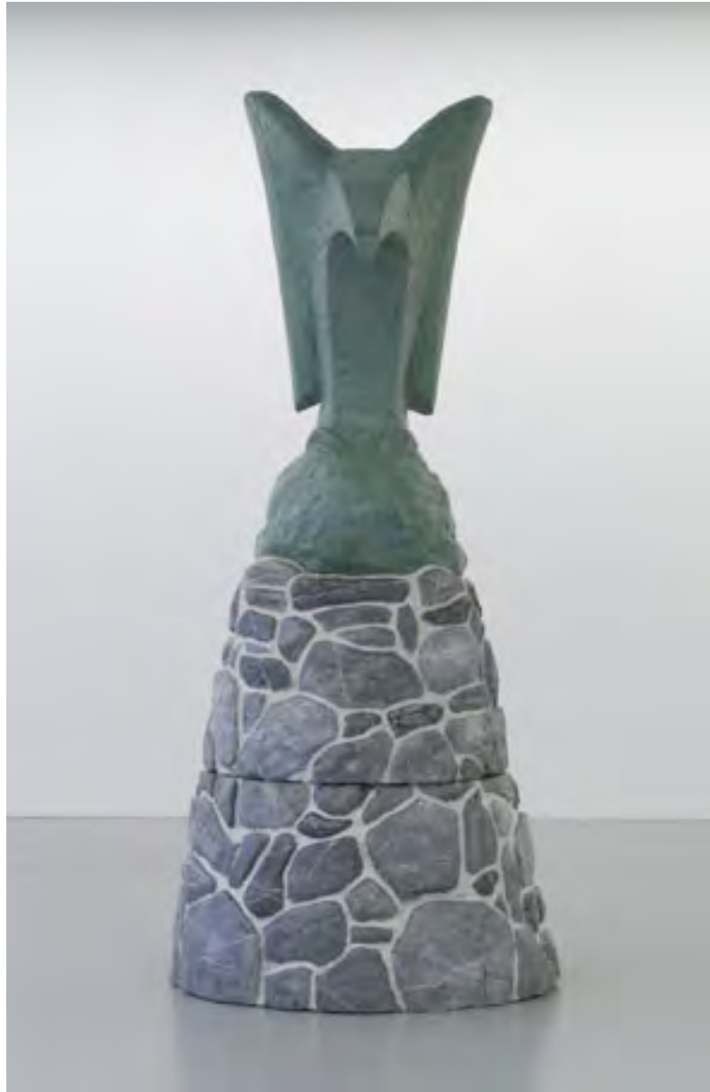
Untitled 2 , 2004, polystyrene, vetroresina, resina sintetica, pittura acrilica , 270 cm height