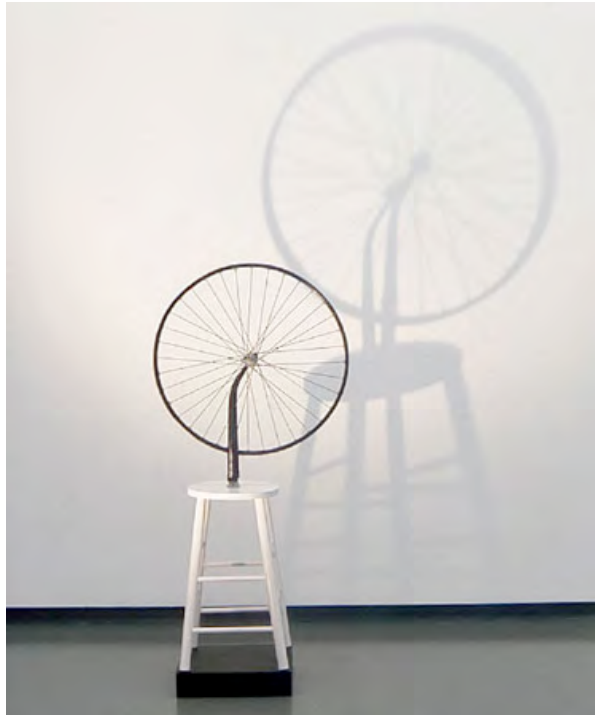
Duchamp Roue, 1967, ruota e braccio di bicicletta, sgabello di legno dipinto