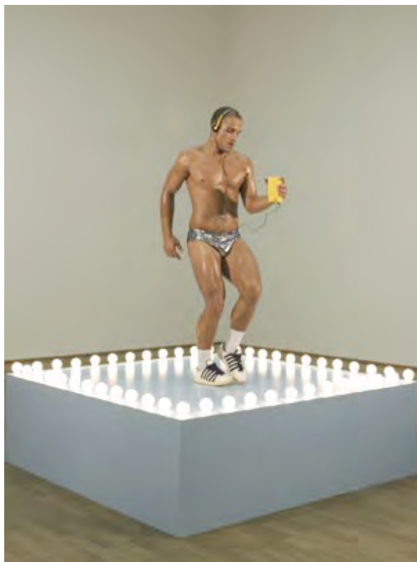
Gonzales-Torres Untitled GoGo dancing platform, 1995, performance, legno, lampadine, cavi elettrici, pittura acrilica