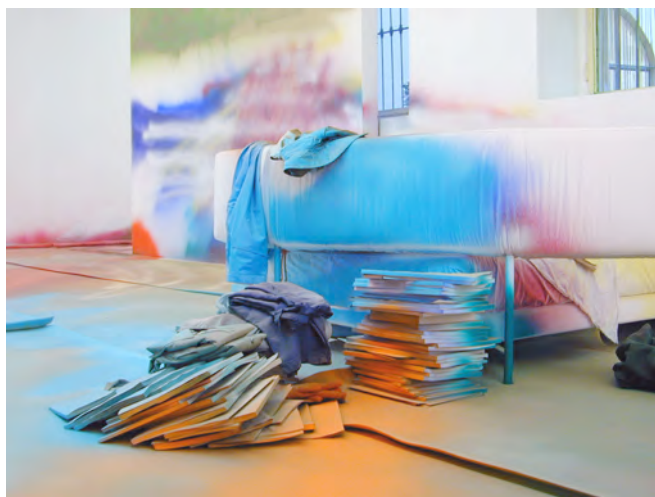
If Music No Good / No Dance , 2004, pittura acrilica su PVC, vestiti, carta, letto, muri e finestre, 440x1745x730 cm

Nel gesto pittorico di Grosse c'è un recupero della matrice gestuale della tecnica pittorica, frutto del confronto diretto con lo spazio, mentale prima che fisico. Lo sviluppo dell'intervento pittorico pur restituendo allo spettatore la parvenza di un'eco romantica, procede da uno studio rigoroso, frutto di un dialogo muto fra l'artista e lo spazio. Katharina Grosse sfrutta accuratamente le specifiche spaziali del sito ridefinendo i confini concettuali dell'espressione site-specific. Le opere-intervento di Grosse rientrano solo formalmente nella definizione canonica del site-specific, in realtà l'artista sfrutta lo spazio fisico come pretesto formale, i materiali disparati sui quali dipinge sono tutti scelti come come spartito sul quale intervenire nello sviluppo di una partitura tutta interiore. Nel tentativo di oltrepassare i limiti della tecnica pittorica, l'artista ad ogni intervento cerca di far sprofondare lo sguardo verso un infinito riverbero cromatico, in una sorta di continuo specchiamento, un effetto droste che imprigiona lo sguardo, ipnotizza e cattura. Nelle opere di Grosse c'è il salto eroico verso una dimensione totalizzante della pittura, sovradimensionata, spiazzante, onnipervasiva.