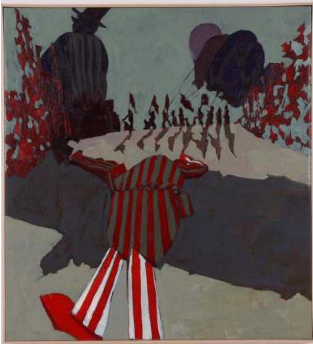
Shane Campbell Red Clown , 2006 Oil on canvas 33.25 x 30.75 x 1.75 inches 84.5 x 78.1 x 4.4 cm