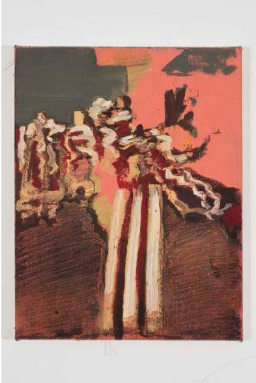
Shane Campbell Clown Down 2008 Oil on canvas 14 x 11 inches 35.6 x 27.9 cm Inv# SC2953