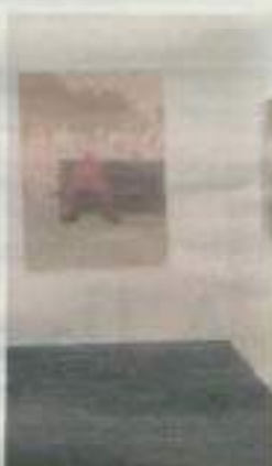
Lo stand di Bortolami