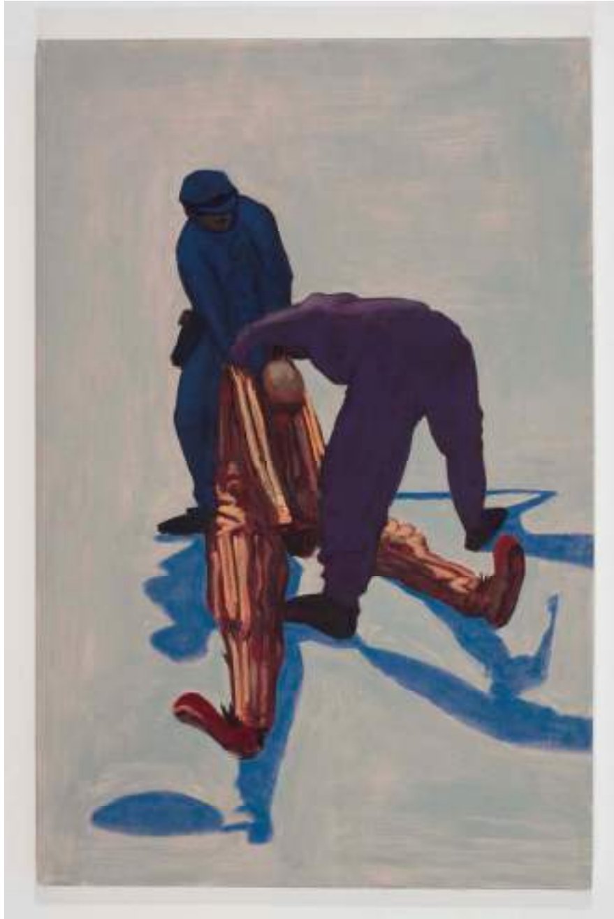
Shane Campbell The Dirge 2008 Oil on canvas 59 x 38.5 inches 149.9 x 97.8 cm Inv# SC2981