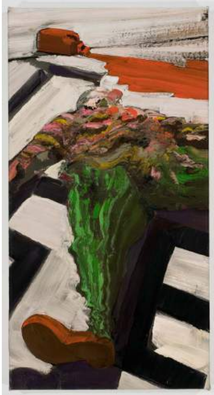
Shane Campbell Death by Kool Aid 2008 Oil on canvas 25.5 x 13.5 inches 64.8 x 34.3 cm Inv# SC2908