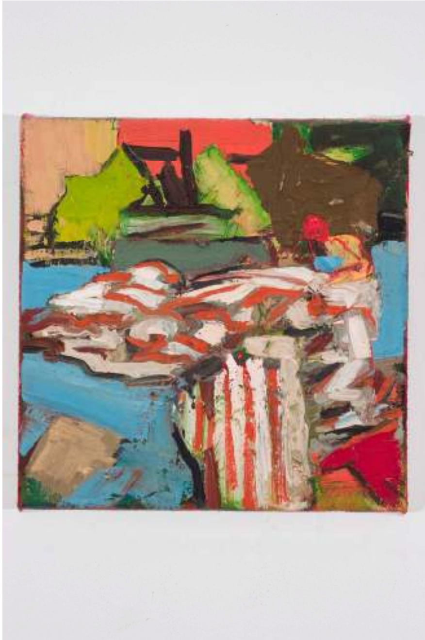
Shane Campbell Clown Down 2008 Oil on canvas 8 x 8 inches 20.3 x 20.3 cm Inv# SC2952