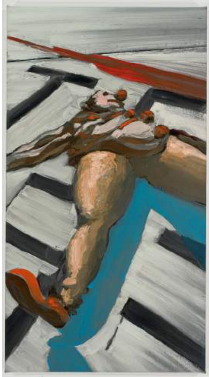
Shane Campbell Death by Kool Aid 2008 Oil on canvas 28 x 15 inches 71.1 x 38.1 cm Inv# SC2909