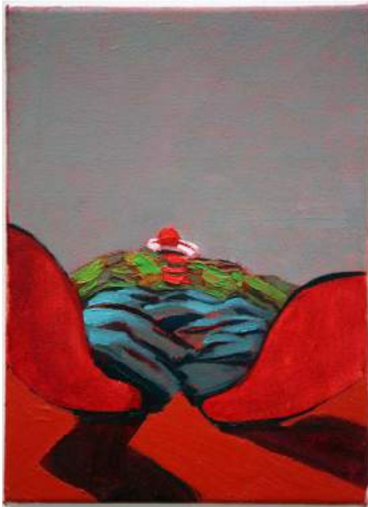
Shane Campbell Clown Down #1 , 2008 Oil on canvas 15 x 11 inches 38.1 x 27.9 cm Inv# SC2394