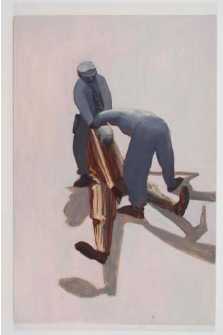
Shane Campbell The Dirge 2008 Oil on canvas 59 x 38.5 inches 149.9 x 97.8 cm Inv# SC2980