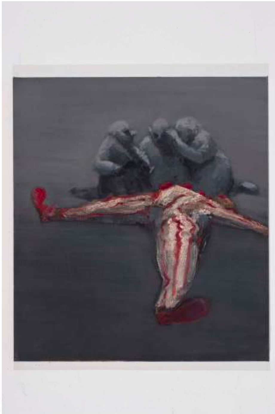
Shane Campbell A Whisper 2008 Oil on canvas 36 x 40 inches 91.4 x 101.6 cm Inv# SC2982