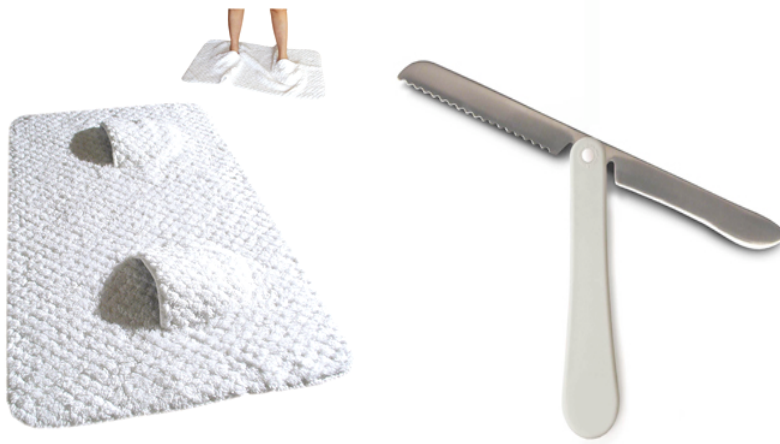
Mat-walk, 2004 | Pane e salame, 1999

opening: Wednesday April 22 2009, 8.00 pm exhibition: from April 22 until May 2 2009 opening hours: everyday from 11:00 am until 7:00 pm venue: Careof and Viafarini, Fabbrica del Vapore, via Procaccini 4, Milan