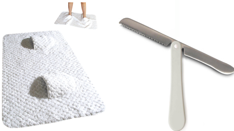
Mat-walk, 2004 | Pane e salame, 1999

inaugurazione mercoledì 22 aprile 2009, ore 20.00 presso le sedi di Careof e Viafarini, Fabbrica del Vapore, via Procaccini 4, Milano