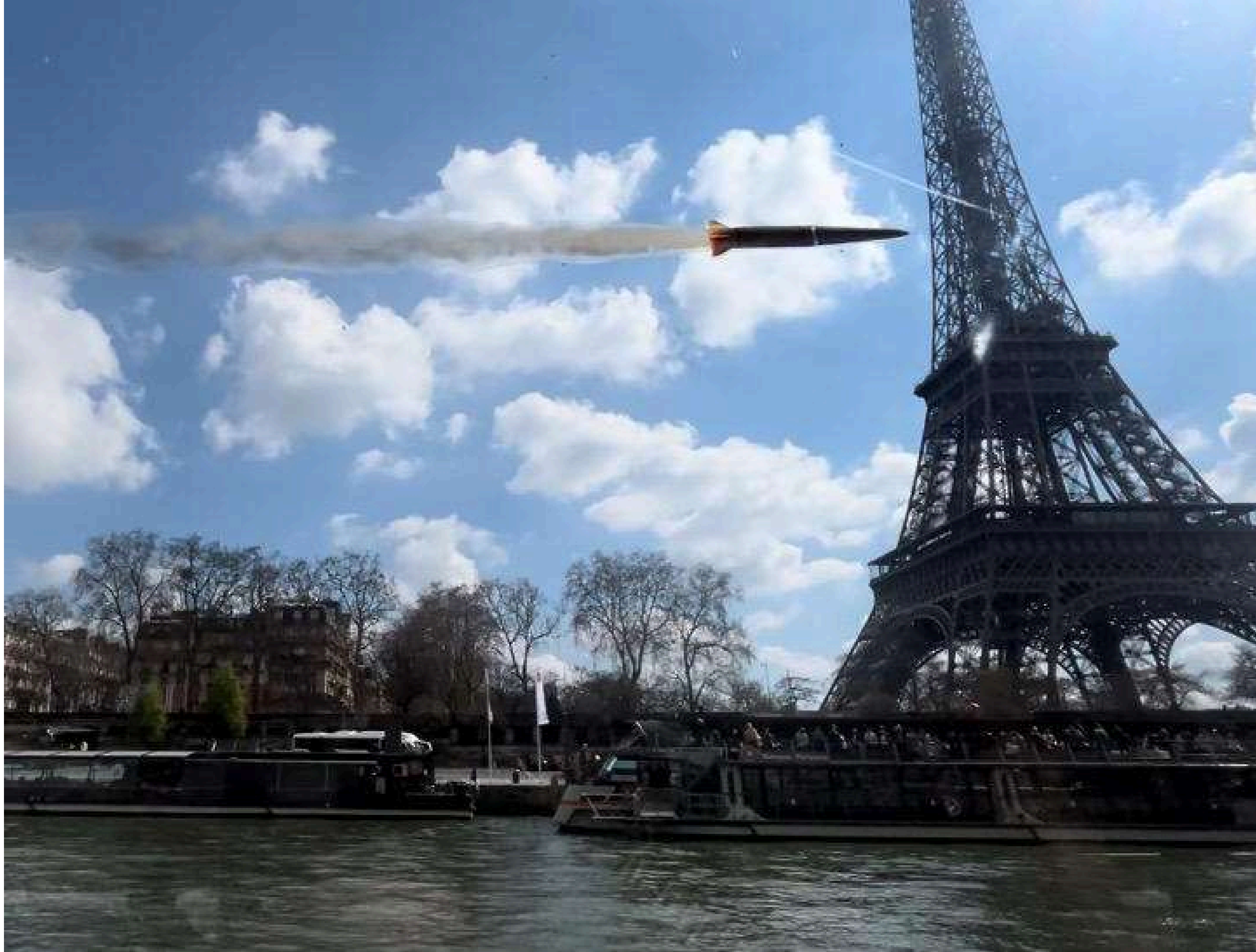
Zhanna Kadyrova, Russian Rocket , 2022