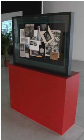
Cornice, vetro, sughero, velluto, facsimili d'artista (stampe laser, fotografie, incisione, falena californiana (Hemileuca Maia), piedistallo