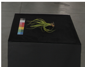
Natura morta Pianta aerea (Tillandsia), stampa laser, pelle sintetica scamosciata