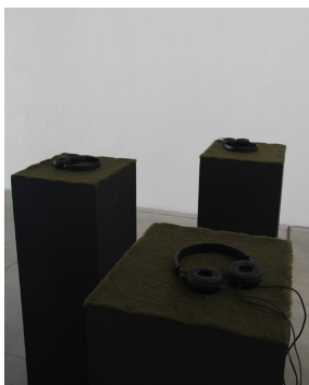
Radio dramma a 4 canali Lettori mp3, cuffie, piedistalli, pelliccia sintetica, 4 episodi di un radio dramma