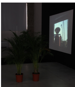
2 piante da interno (Chamaedorea Elegans), video proiezione, pelliccia sintetica