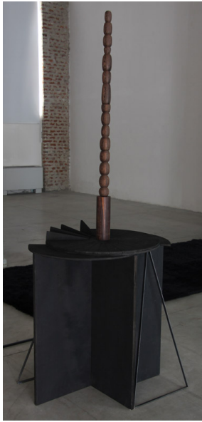
Legno wengé, ebano, compensato marino tinto di nera, ferro