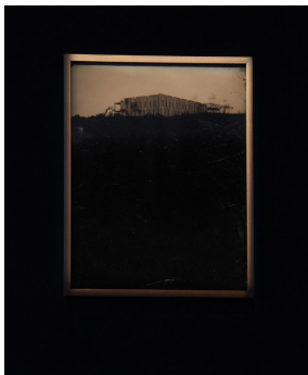
Stampa a collodio umido su vetro Realizzato in collaborazione con l'artista Noah Doely